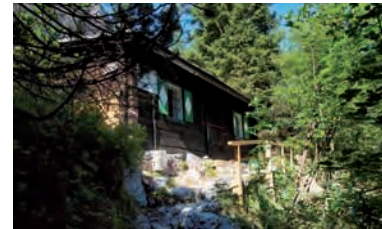
Die alte Haindlkarhütte als Standort bei Schlechtwetter.

Untergebracht und gepflegt werden wir in der Haindlkarhütte, als Stützpunkt steht uns zusätzlich auch die „alte“ Haindlkarhütte als Alpinwerkstatt zur Verfügung. Die meiste Zeit werden wir aber ohnehin draußen unterwegs sein.