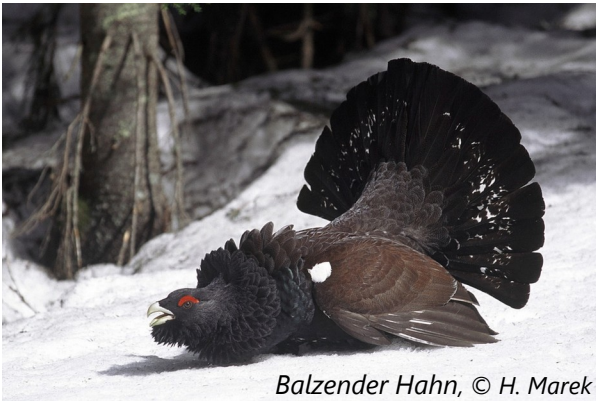
Balzender Hahn

In der Steiermark ist die Art ein regional vorkommender Jahresvogel. Die Bestände im Norden der Steiermark werden als zufriedenstellend eingeschätzt. Die Zahl der Individuen nimmt allerdings jährlich ab.