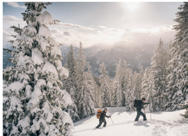
Illustration: H. Steffin; Gestaltung: F. Huber, huberundpartnerin.at; Druck: Wallig, Gröbming. Satz- und Druckfehler vorbehalten. Stand Mai 2021.